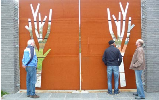
Rondleiding op de nieuwe begraafplaats in Hoorn