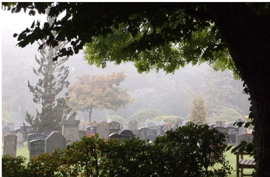
Begraafplaats Bergklooster in Zwolle op een mistige ochtend