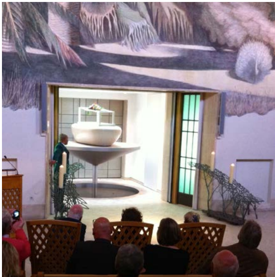
Aula De Nieuwe Ooster te Amsterdam