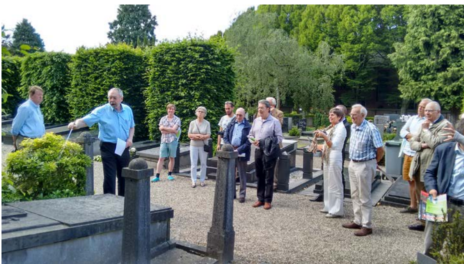
Excursie tijdens de Week van de Begraafplaats op het Catharinakerkhof in Eindhoven

In het verslagjaar 2015 was de LOB op vele fronten actief. Hieronder een greep uit de belangrijkste activiteiten.