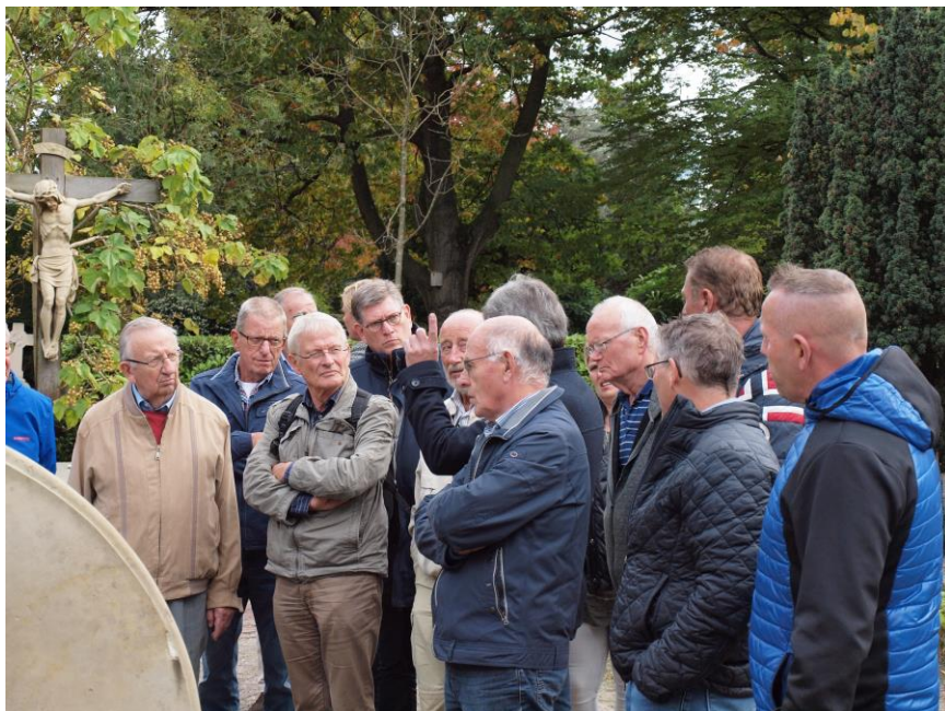
Rondleiding tijdens de Regiodag op de RK Begraafplaats Buitenveldert in Amsterdam