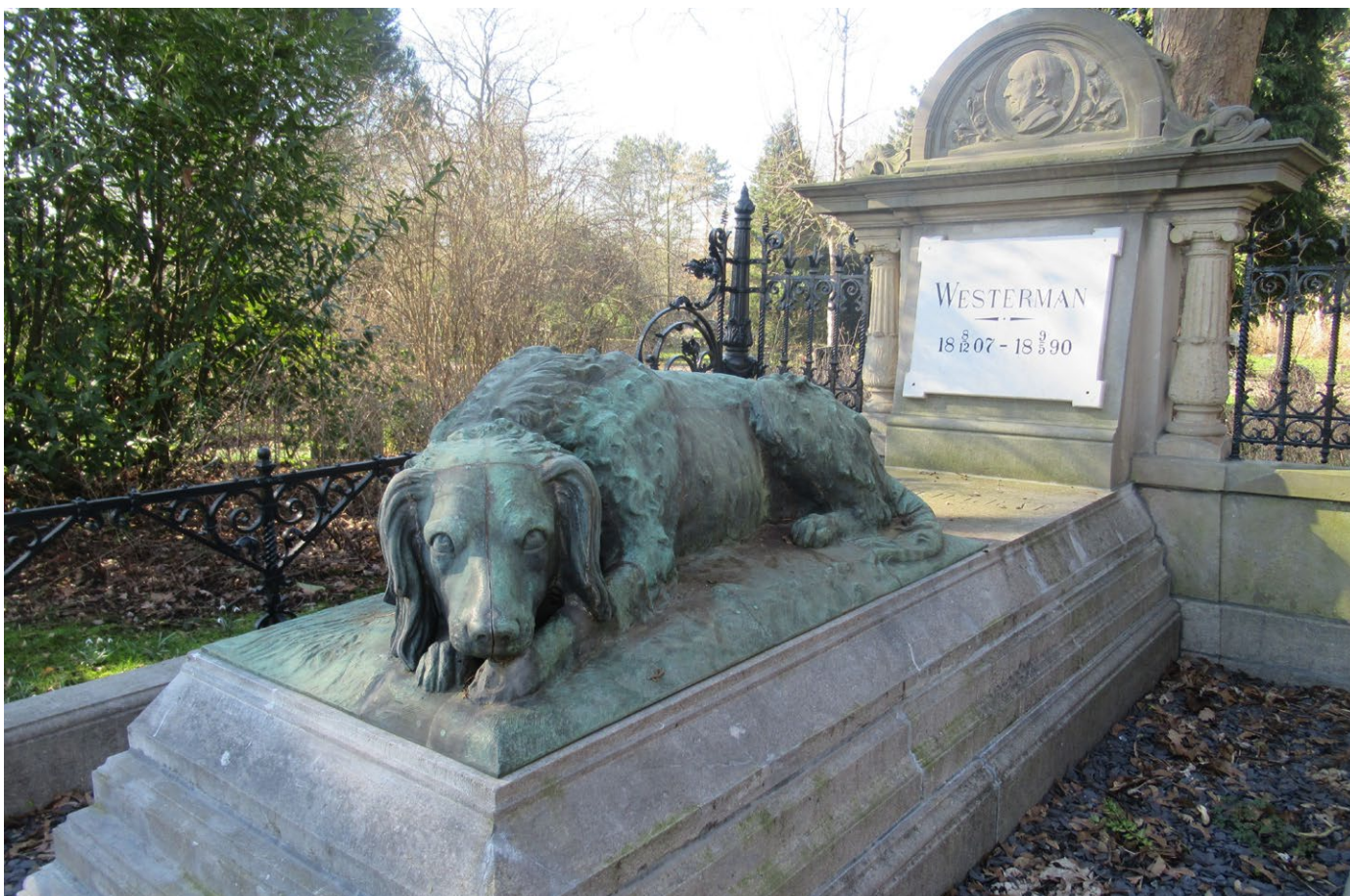
Links: graf familie Groen van Waarder in Muiderberg, foto: Pauline Prior. Rechts: graf Westerman op De Nieuwe Ooster, foto: Anja Krabben

verdriet om de dood van zijn baas geweigerd hebben te eten en te drinken en drie dagen later ook zijn overleden. Is het inderdaad een waarheidsgetrouw portret van Pompey en klopt zijn trouw tot in de dood? We weten het niet zeker, maar wat maakt het uit, het verhaal is te mooi om niet te (willen) geloven.