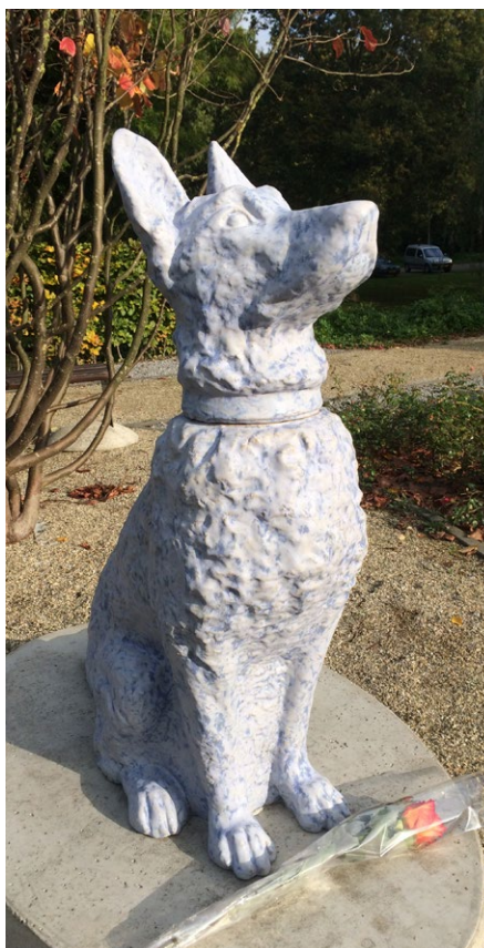
Een van de twee honden in Delft.

Ook op de hedendaagse begraafplaats is de hond aanwezig als trouwe grafbewaker. Op de oude, algemene begraafplaats van Muiderberg (1796) staat het imposante grafmonument van de familie Groen