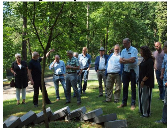
Rondleiding op begraafplaats Heiderust in Rheden