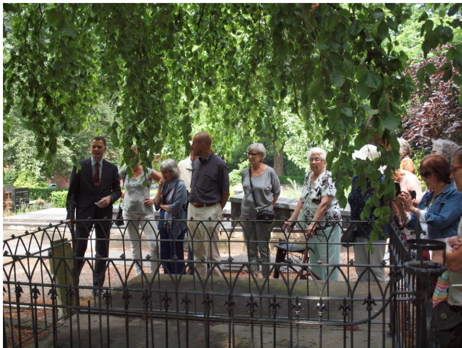
Rondleiding tijdens de Week van de Begraafplaats op Oud Eik en Duinen in Den Haag