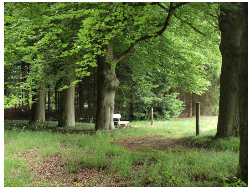
Natuurbegraafplaats Heidepol in Arnhem

Natuurbegraafplaatsen zijn nieuwswaardig. In de media werd vooral geschreven over de plannen voor de aanleg van een nieuwe natuurbegraafplaats op een landgoed en/of in een bosperceel.