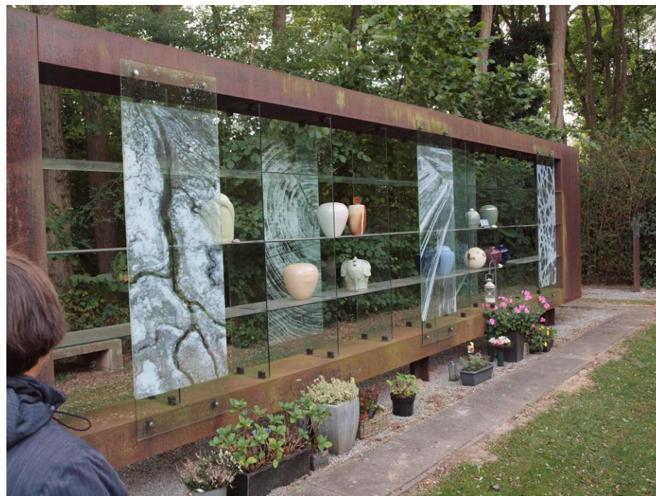
Asbestemming op begraafplaats Orthen in 's-Hertogenbosch