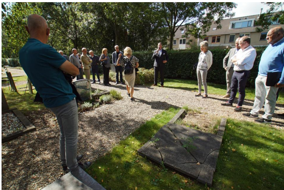
Regiodag in Rotterdam IJsselmonde