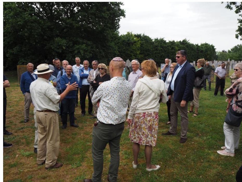
LOB Regiodag 4 juni, bezoek Joodse Begraafplaats in Katwijk aan den Rijn