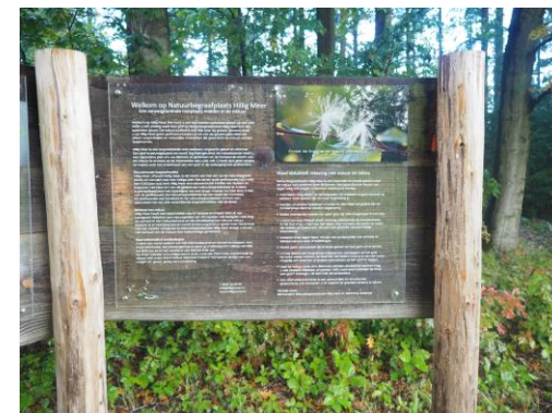
Natuurbegraafplaats Hillig Meer

Eind 2019 telde Nederland 23 natuurbegraafplaatsen. Daarnaast zijn er diverse initiatieven voor de aanleg van nieuwe natuurbegraafplaatsen. Het aantal natuurbegraafplaatsen maakt 0,4% uit van het totale aantal begraafplaatsen in Nederland. Het aantal begravingen op natuurbegraafplaatsen verdubbelt zich per twee jaar.