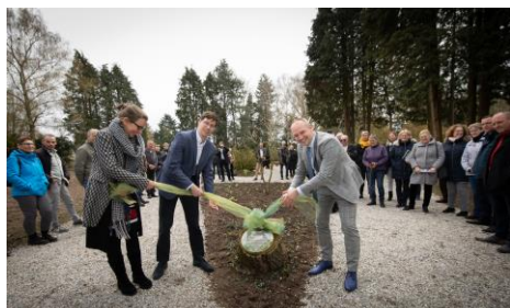
Opening van de natuurbegraafplaats in Wageningen.

De regionale bijeenkomsten (Regiodagen) zijn een belangrijk platform voor onderlinge contacten en uitwisseling van kennis en informatie voor zowel beheerders en bestuurders van begraafplaatsen als medewerkers van het Bedrijfsbureau. In 2019 werden deze bijeenkomsten goed bezocht door de leden.