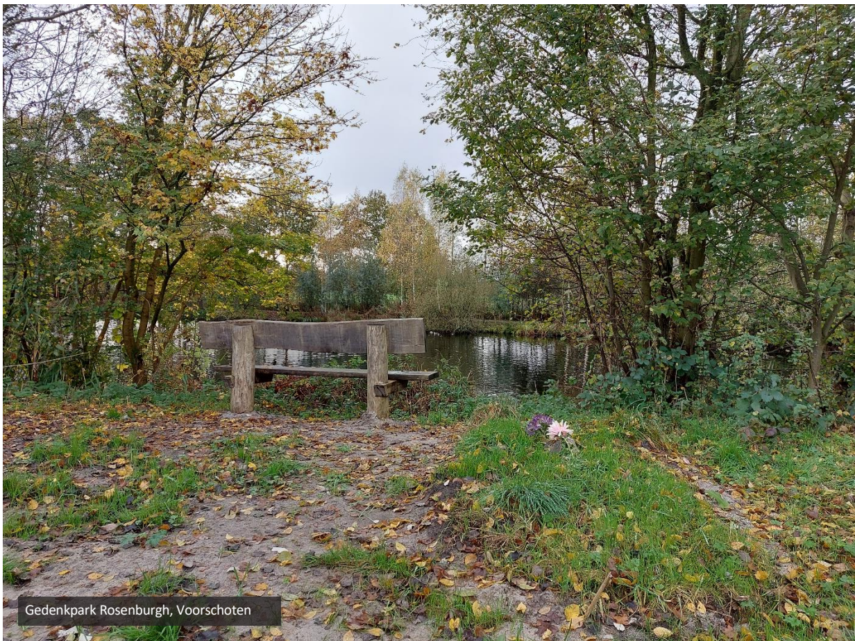
Gedenkpark Rosenburgh, Voorschoten

Veel mensen zijn steeds meer bezig met het klimaat en duurzaamheid. Zij willen een zo klein mogelijke ecologische voetafdruk achterlaten. Begraven in de natuur, het bos of een nog te ontwikkelen natuurgebied is hierbij een duidelijke trend. Eén met de natuur en geen rijen met grafzerken met aangeharkte paden ertussen. Natuurbegraven spreekt daarom steeds meer mensen aan. Toch heeft niet iedereen de mogelijkheid om op een natuurbegraafplaats begraven te worden. Dit kan komen door de tarieven; een natuurgraf heeft een andere prijsstelling dan een traditioneel algemeen graf. Een andere reden kan zijn dat men geen binding heeft met de locatie van de natuurbegraafplaats. Het is simpelweg te ver van huis om er binding mee te hebben en op een bereikbare wijze grafbezoek mogelijk te maken. Omdat er een beperkt aantal natuurbegraafplaatsen in Nederland zijn, is de fysieke afstand van de woonplek tot een natuurbegraafplaats veelal (te) groot. Men wordt dan toch liever in de eigen omgeving begraven. ■