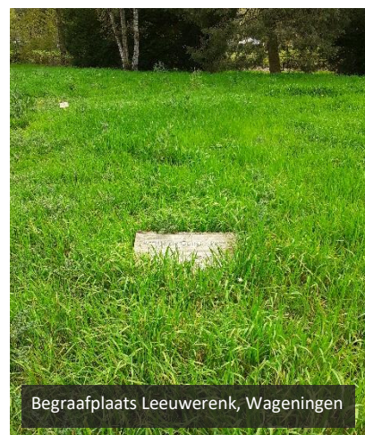
Begraafplaats Leeuwerenk, Wageningen