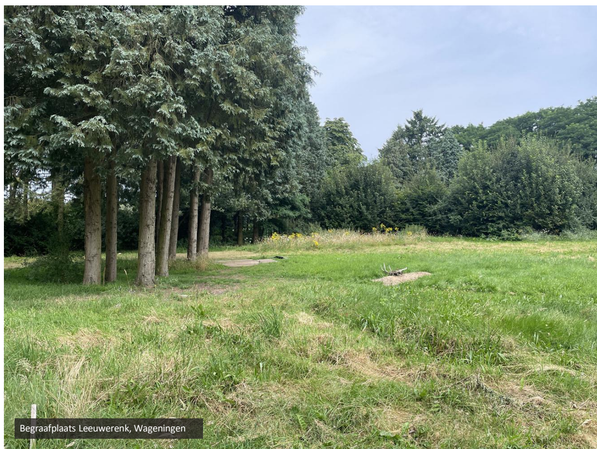
Begraafplaats Leeuwerenk, Wageningen