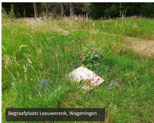
Begraafplaats Leeuwerenk, Wageningen

Het argument van een externe initiatiefnemer om een natuurbegraafplaats te willen realiseren speelt daarop in: 'Zo houden we de natuur in stand' of 'Met de realisatie van een natuurbegraafplaats creëren we nieuwe natuur' . Dit is mogelijk de werkelijke doelstelling, waarbij met de inkomsten van grafuitgifte en begraven, het beheer van het terrein wordt bekostigd. Maar met grafuitgifte voor onbepaalde tijd, vraagt de continuïteit van de begraafplaats op zeer lange termijn wel extra aandacht en zekerheden. Wanneer de doelstelling van de natuurbegraafplaats als eerste natuurbeheer of natuurontwikkeling is en de functie begraafplaats pas op de tweede plaats komt, kan het belang van zowel de overledene, als van de nabestaanden daaraan ondergeschikt raken, zeker op lange termijn. ■